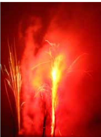
Ilotulitus uudenvuodenaattona 2007

Sundsbergin talvirieha järjestettiin 11.3.2007 Sipulin leirikeskuksessa. Samassa yhteydessä järjestettiin myös lastentarvikekirppis. Pyörien turvamerkintäkampanja pidettiin 29.4.2007. Sundsbergin kansanjuhlaa vietettiin 11.8.2007. Kansanjuhla aloitettiin taloyhtiöiden välisellä katusählyturnauksella, jonka jälkeen tapahtuma jatkui Red Hill Rats -bändin esiintymisellä. Syysolympixit ja kirppis pidettiin Sipulin tiloissa 23.9.2007. Wanhanajan joulumarkkinat houkuttelivat myyjiä ja ostajia 2.12.2007 päiväkodin pihalle ja alueen aktiiviset